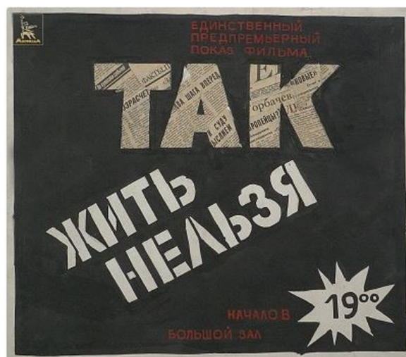
Афиша фильма «Так жить нельзя», 1990 г.