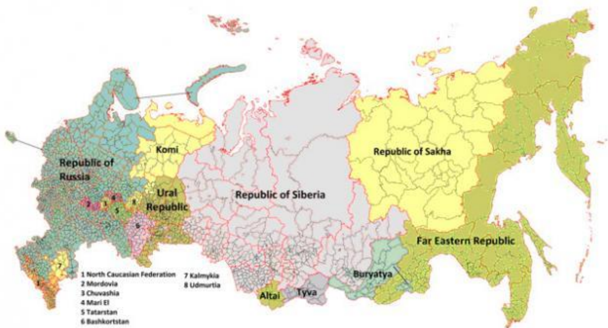
One of the many maps drawn up by fantasists who dream of partitioning Russia into a collection of smaller independent states

С начала «Специальной военной операции» России на Украине прошло более 5 месяцев, и многое стало очевидным. В частности, становится понятным, что вопреки некоторым первоначальным прогнозам война будет долгой. Однако многое так и остается скрытым, непонятным и, как выражаются политкорректно в российских радио и телеэфирах приглашенные эксперты и сами ведущие, вызывает вопросы. Так, никто не берется предсказать, когда и чем закончится война на Украине. Единственное, что ясно всем, так это то, что война не закончится до тех пор, пока одна из сторон не потерпит в ней поражения. В российских СМИ