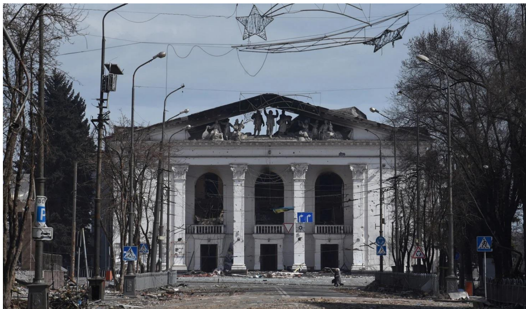
Мариуполь, драмтеатр, май 2022 г.