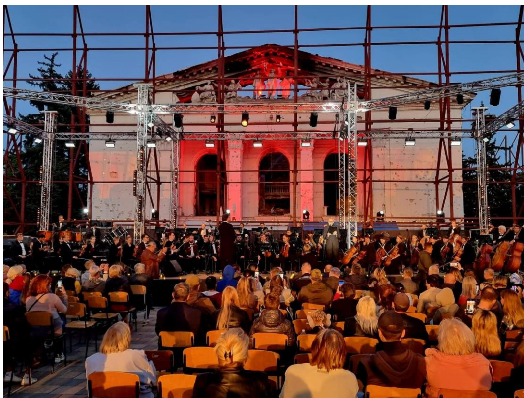
Мариуполь, концерт перед драмтеатром, 12 сентября 2022 г.