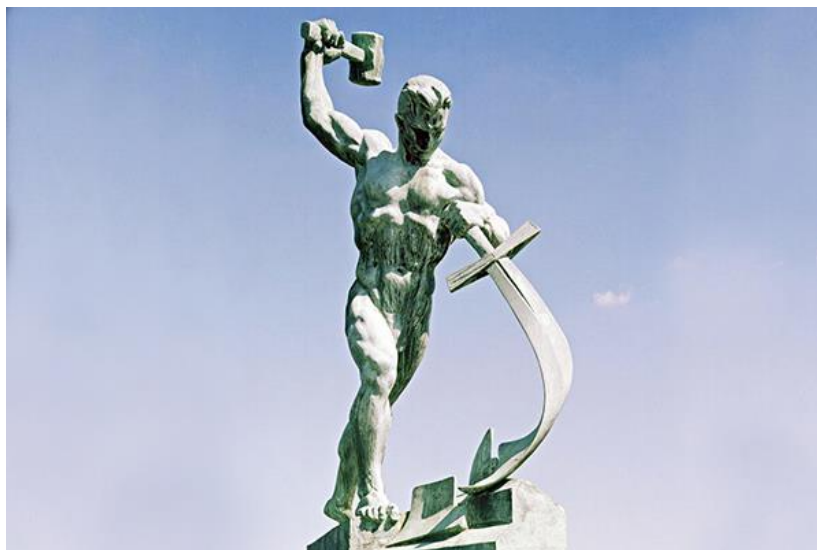
Статуя «Перекуём мечи на орала», установлена у здания ООН в Нью-Йорке в 1957 г. Скульптор – Е.В. Вучетич.

Стремление США и других стран капиталистической метрополии сохранить существующую систему глобального капитализма и свое политическое, экономическое и военное господство на планете является истинной причиной тщательно подготовленной и ведущейся Западом против России войны на Украине, фактически являющейся начальной стадией Третьей мировой войны. На США, их союзниках и вассалов, прежде всего странах НАТО лежит главная ответственность за возрастание международной напряженности, терроризма, гонки вооружений, угрозы войн, в т.ч. т.н. гуманитарных интервенций, и государственных, в т.ч. военных, переворотов. Угроза новых войн будет устранена только с ликвидацией глобального и всякого иного капитализма, в результате его революционного преобразования в коммунизм. Это длинный и трудный путь. Главным в движении по этому пути вперед сейчас является борьба против империалистической агрессии НАТО, за нахождение и применение надежных средств предотвращения военных конфликтов, за новую надежную систему международной безопасности, за прекращение гонки вооружений и последующее постепенное разоружение. Поэтому: