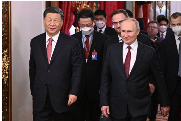
Встреча президента РФ В. Путина и председателя КНР Си Цзиньпина

Основная же цель президента России Владимира Путина во время визита китайского лидера состояла, как считают авторы статьи, именно в том, чтобы добиться согласия Си Цзиньпина на строительство этого газопровода. И в статье подчеркивается, что на второй день визита российский президент говорил о проекте «Сила Сибири-2», как уже о достигнутом соглашении, по которому «практически все параметры уже обговорены».