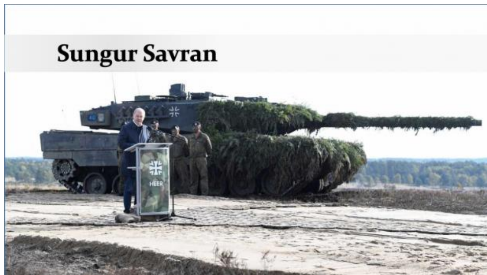
Канцлер Олаф Шольц и его "Леопард-2" указывают на восток

Война на Украине стала катастрофой для международных левых [1]. Мы, конечно, говорим о левых движениях, которые называют себя “социалистическими” или “коммунистическими”. Хотя эта война во всех отношениях является детищем империализма, спровоцированным, вызванным, увековеченным империализмом и используемым в его будущих целях, значительная часть международных левых обсуждает войну, либо отодвигая проблему империализма на задний план, либо полностью игнорируя ее. То же самое верно для левых в Турции, где в 1960-х и 1970-х годах укоренилась очень радикальная антиимпериалистическая традиция, многие революционные кадры отдали свои жизни, сражаясь за изгнание НАТО из страны.