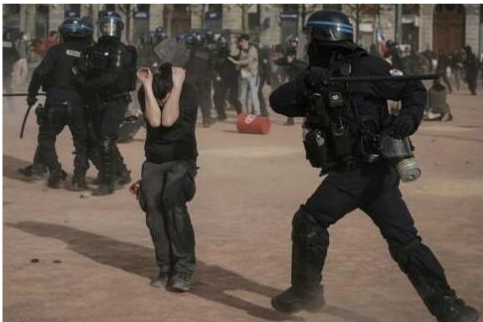
Лион, 23 марта 2023 г.

No comments. «Некоторые офицеры думают, что все позволено»