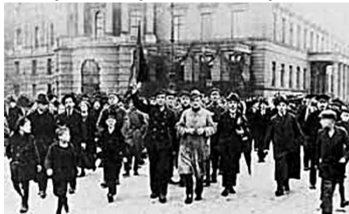
Карл Либкнехт на демонстрации

1918.11.11 РСФСР. Москва. СНК обсуждает вопрос о революции в Германии. Постановление ВЦИК о направлении в Берлин двух эшелонов с хлебом и создании продовольственного фонда помощи рабочим и солдатам Германии.