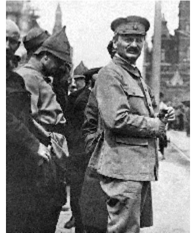
Председатель Реввоенсовета республики, нарком по военным и морским делам Л.Д.Троцкий

фронтов. В этих условиях превосходство в маневренности давало белым громадное преимущество. Августовский (1919 года) рейд корпуса Мамонтова по тылам Южного фронта, дезорганизовавший его деятельность и отвлекший на себя большие силы с фронта, был самым знаменитым, но далеко не единственным эффективным предприятием белогвардейской конницы. В конечном счете, однако, красная конница победила белую, и не только за счет взаимодействия с более многочисленной пехотой, но и непосредственно в прямых боевых столкновениях. Почему? Красные противопоставили численному превосходству белых более совершенную организацию, в том числе централизацию управления, более высокое военное искусство и моральное превосходство. Все это было достигнуто не сразу. Численное превосходство белых в «саблях» естественно получилось с самого начала за счет казачества. Значение конницы в маневренной войне выявилось довольно скоро, но только после многочисленных поражений оно было в полной мере осознано большевистским руководством к осени 1919 года. Только тогда стали направлять в конницу всех, кто был на это способен, хотя кавалерийские командиры давно предлагали усиление роли своего рода войск. Против создания крупных кавалерийских объединений выступал Троцкий, который