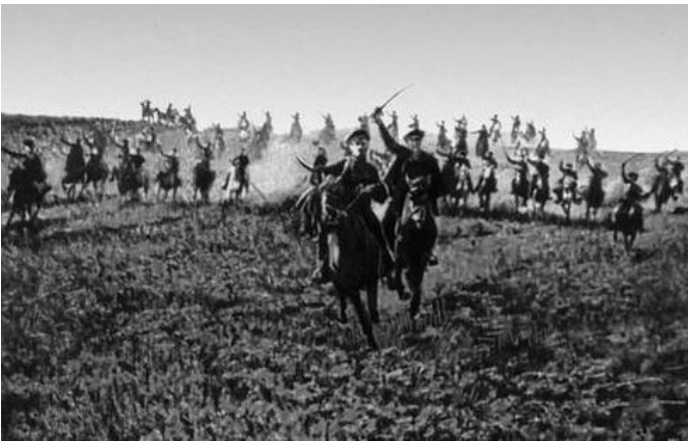
Части Первой конной в атаке

Донбасская операция, а 8 января Красная армия вступила в Ростов. Борьба на юге еще не была завершена. Остатки деникинской армии эвакуировались в Крым морем из Новороссийска 4 марта, но серьезной угрозы Советской республике с юга после взятия Ростова уже не было. Впрочем, необратимый крах деникинщины вполне определенно завершился в конце октября. 2 ноября в Харькове командующий Добровольческой армии генерал В. Май-Маевский вынужден был признать Деникину, что потерял управление беспорядочно отступающей армией, которая состояла в основном из