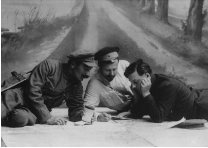
Легендарные командиры Первой конной

ноябре. Это была Первая конная армия, созданная в конце ноября на основе корпуса Буденного. В декабре она состояла из 3 кавалерийских и 2 стрелковых дивизий. 25 декабря Буденный разбил во встречном сражении численно превосходящую конную группу Улагая. 31 декабря завершилась