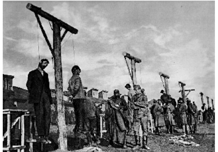
Расправа белочехов над советскими активистами

Намного менее надежны остальные данные, без которых не обойтись, однако, при оценке потерь. Согласно до-революционной статистике чистый прирост населения в «нормальные» годы составлял 2,4 млн. в год, а рождаемость - 7 млн. При этом до 25% новорожденных не доживало до года, а до 5 лет - почти 45%. И это в благополучные времена. Очень велик разброс оценок численности населения в 1914 году (накануне империалистической войны) в границах 1926 года. Будем ориентироваться на сравнительно правдоподобную оценку в широком интервале - 142 - 147 млн. человек. При этих предположениях дефицит населения к 1926 году по сравнению с гипотетическим вариантом «демографического развития без катаклизмов» достигает 25-30 млн. Это огромная величина. Причем прямые боевые потери сравнительно невелики: около 2 млн. в империалистическую войну и почти столько же в гражданскую, включая все виды террора и бандитизма.