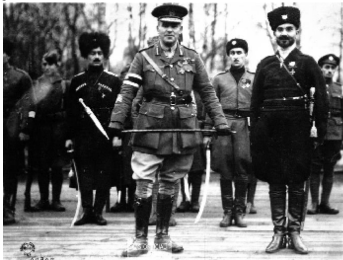
Антисоветское «воинское братство». Архангельск, 1919 г.

ла жителей востока и юга, где неоднократно менялась власть и прошли фронты гражданской войны. Это были основные хлебопроизводящие регионы. Именно они пострадали в наибольшей степени от гражданской войны, а в 1921-22 годах - от жесточайшего голода. Отрывочные статистические данные, которые имеются, указывают на противоположные тенденции развития сельского хозяйства в производящих и потребляющих регионах. В производящих регионах производство неуклонно деградировало, даже без климатической катастрофы. А в потребляющих местностях производство продовольствия росло, причем на огородах больше, чем на полях. Огородничество стало серьезным подспорьем, в том числе и для горожан. Можно напомнить для иллюстрации следующий эпизод. В октябре 1920 года Советскую Россию посетил знаменитый английский писатель Герберт Уэллс. Широко известна его тогдашняя встреча с В.И. Лениным. Для нас здесь интерес представляет другое. Уэллс был приглашен на заседание Петроградского Совета и даже принял приглашение выступить с его трибуны. В своей книге «Россия во мгле» он отметил, что попал не на деловое заседание, а в атмосферу многолюдного митинга. Хотя на заседании обсуждались важнейшие общегосударственные вопросы, в том числе невыгодные условия мира с Польшей, самый большой интерес присутствовавших вызвал вопрос об огородничестве. Люди вскакивали, ругались, кричали с места, перебивали друг друга. Очевидно, развитие огородничества было вопросом выживания для самой широкой массы столичных жителей.