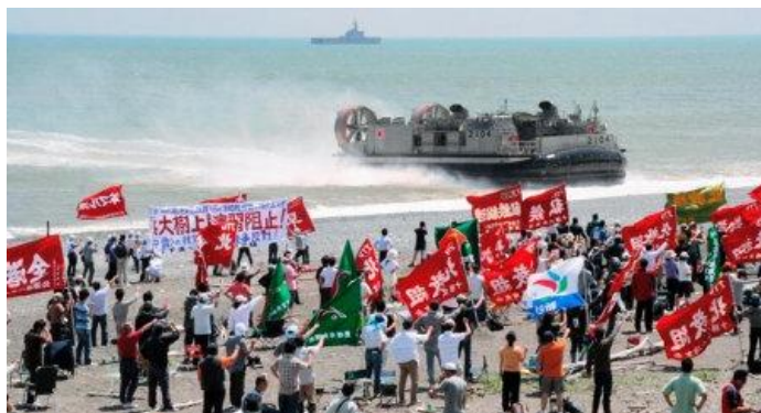
Акция протеста против десантных маневров на Хоккайдо в июне 2009 г.