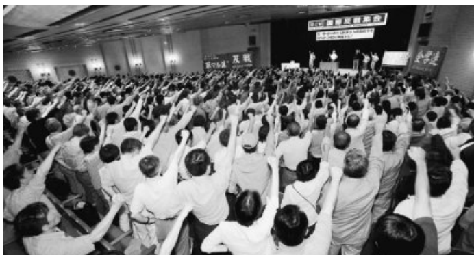
Центральное собрание в Токио

В Токио 47-ая международная антивоенная ассамблея была устроена в доме в Гиндза. Рабочие, студенты и интеллигенты собирались один за другим, у входа зала полу-