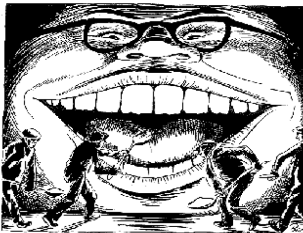
Капитализм глазами Х.Бидструпа

Не стоит забывать и о том, что в начале 1950-х годов советская элита устала от Сталина, который административные конфликты решал арестами, пытками и расстрелами.