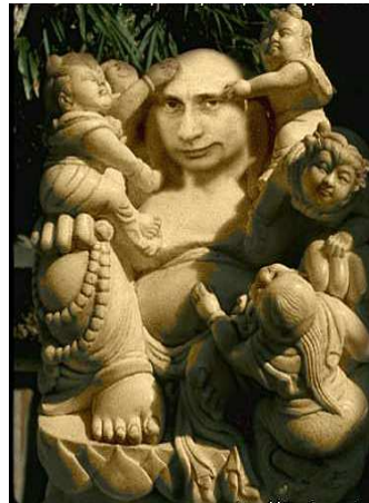
Вождь и дети. Мрамор. Подарок корейских трудящихся -- Ред.

"Каждой маме по ребенку?! Это мало!.. Надо двух!" И теперь в родной сторонке Появились детки вдруг. Много их... Они красивы. Как цветочки, там и тут. Малышей теперь в России ПУТИНЯТАМИ зовут!»