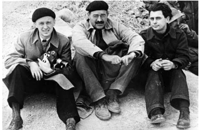
Слева Р.Кармен, рядом Э.Хемингуэй

В казармах Карла Маркса мы сняли формирование первых интернациональных частей — батальон Тельмана, сентурия «Димитров»; в колоннах, выстроившихся на казарменном плацу, стояли успевшие уже прибыть в Испанию антифашисты — французы, немцы, итальянцы, болгары. Волевые, полные решимости сражаться с фашизмом люди стояли с оружием в руках в боевом строю. Это были первые звенья будущих интернациональных бригад.