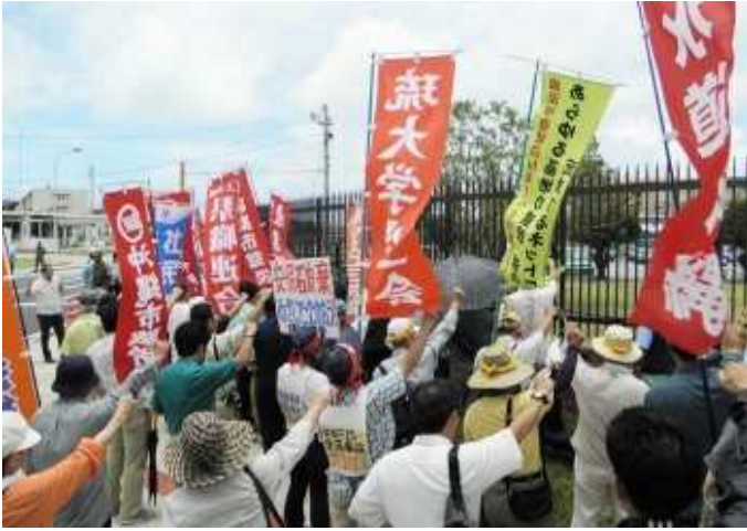
Протест против базы США на Окинаве

ных и растений обнаруживается одно за другим. Несмотря на такое критическое положение, монополистические капиталисты упорствуют в отстаивании АЭС, так как боятся повышения мировых цен на ресурсы, начиная с нефти. Мировая конкуренция в приобретении ресурсов обостряется между государствами или монополистическими предприятиями: особенно, между Китаем, укрепляющим свою экономическую и военную мощь, и американским империализмом, обнаруживающим угрозу потери своего влияния. В Азии, на Ближнем Востоке и в Северной Африке, во всем мире, сейчас народы находятся в огне войны или стоят перед кризисом вспышки новой войны. Вместе проводить борьбу против войны, против АЭС — антинародных ядерных разработок, против распространения нищеты и усиления эксплуатации!»