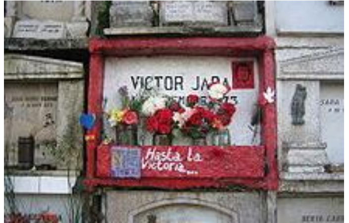
Могила Виктора Хары на Центральном Кладбище Сантьяго. Надпись: «До победы!»