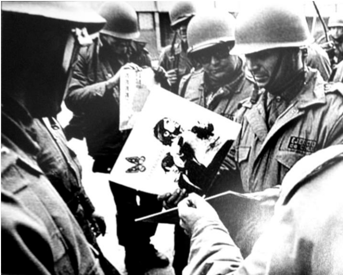
Фашисты Пиночета рассматривают пластинку песен Виктора Хары, посвященных его жене и матери. В следующий момент они бросят пластинку в огонь

В 2003 году стадион, где погиб Виктор, был назван его именем. В прошлом году, получив от членов семьи Виктора Хары новые свидетельства, касающиеся его гибели, чилий-