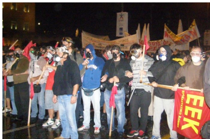
Колонна ЕЕК на демонстрации 7 ноября в Афинах

Вперёд к всемирной социалистической революции, стартовавшей атакой Зимнего дворца!