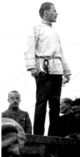
Джон Рид выступает в революционном Петрограде

Рассказывает Дос Пассос: «Джек Рид хотел жить в бочке и писать стихи; но он продолжал встречаться с бродягами, рабочими, дюжими ребятами, которых он любил, обездоленных, безработных, почему бы не революция? Он не мог заниматься своим делом, когда в мире столько обездоленных; не он ли выучил в школе наизусть Декларацию независимости? Рид был уроженцем Запада, и что он говорил, то он и думал... Жизнь, свобода и стремление к счастью; ими даже не пахло на шелкопрядильнях, когда в 1913-м он поехал в Паттерсон, чтобы писать о стачке, о демонстрациях текстильщиков, избитых фараонами, о забастовщиках, брошенных в тюрьму; он и оглянуться не успел, как сам стал забастовщиком, демонстрантом, избитым фараонами, брошенным в тюрьму; он не позволил редактору