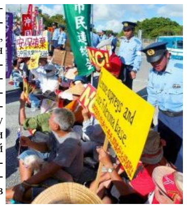
Протест против размещения конвертопланов "MV22 Osprey" на американской базе Футэнма на Окинаве

осени наши товарищи-работчие и студенты Дзэнгакурэна поднялись на борьбу, как только выяснился план постановки этого законопроекта на повестку дня заседания Палаты. Мы разоблачили то, что закон об охране тайны составляет пару с законом об установлении Совета Национальной Безопасности (NSC японского типа), и что цель обеих законов заключается в создании «военно-могущественного государства Японии». Студенты Дзэнгакурэна боролись во главе трудового народа, собравшегося перед палатой, в солидарности с революционными рабочими, организующими объединения по профсоюзу или по службе. В частности, со 2-го до 6-го декабря перед голосованием в Палате они горячо протестовали до глубокой ночи. Воодушевленные ежедневными смелыми актами студентов и трудящихся, многие ученые, журналисты, артисты, религиозные люди, режиссеры, актеры и актрисы один за другим выступили против этого закона. Движение протеста активно расширялось – 16 000 человек участвовали в митинге 6-го декабря в центральном парке в Токио.