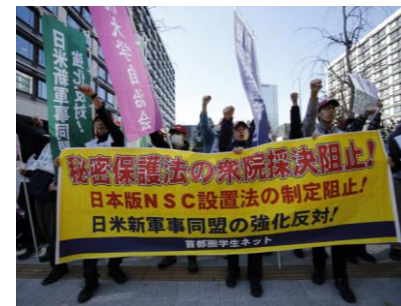
Демонстрация Дзэнгакурэна против закона об охране гостайны

Между тем руководители японской компартии говорили, что "выступаем против закона об охране гостайны, потому что он лишит граждан права на доступ к информации и разрушит демократию". Они свели суть дела к защите буржуазной демократии и, таким образом, обнаружили свой парламентский крегизм (сегодня они ставят своей целью "собрать голоса также и консервативных слоев"). Многие из рабочих и интеллигенции сочувствовали нашим лозунгам «Против увеличения военных сил! Против укрепления японо-американского военного союза! Против неофашизма!».