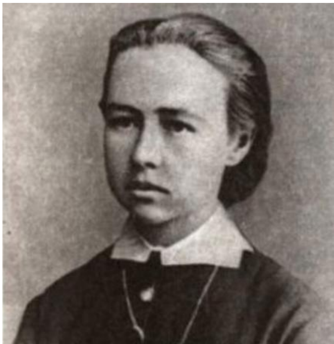
Софья Львовна Перовская

Три с лишним десятилетия тому назад в городе, названия которого давным-давно нет на карте нашей страны, да и страны этой уже нет, попала мне в руки книга моего любимого писателя. В центре города, названия которого давным-давно не найти на карте, была улица, названная в честь героини этого романа, ныне, вслед за именем города, исчезнувшая напрочь, улица, по которой мы, тогдашние подростки, теплыми весенними вечерами прогуливались, даже не думая толком о той, кто дал этой улице имя, о судьбе её и деле всей её короткой жизни. Сейчас от той весны, от навсегда ушедшего прошлого остались одни лишь воспоминания, да скромный томик, изданный в серии «Пламенные революционеры». Роман Юрия Трифонова «Нетерпение». Роман о революционной морали и революционной этике. Роман, посвященный героям и мученикам «Народной Воли». Роман, главными действующими лицами которого являются руководители народовольцев Андрей Желябов и Софья Перовская.