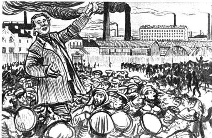
Борис Кустодиев. Митинг на Путиловском заводе. Забастовка. 1906.

Руководство ЗАО «Форд мотор компани» объявило о начале массовых сокращений персонала. Если эти планы будут реализованы, рабочих мест лишатся порядка 700 человек, т.е. каждый второй производственный работник.