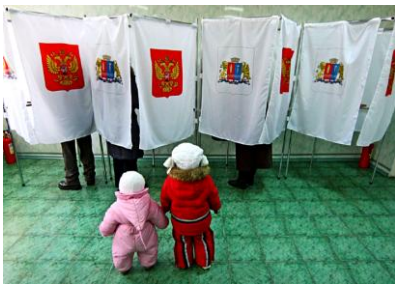
Дети ждут своих родителей на одном из избирательных участков в России.

На фоне нарастающего кризиса в экономике, ухудшения социальной ситуации и роста протестных настроений буржуазная российская власть продолжает экспериментировать с изменениями избирательного законодательства.