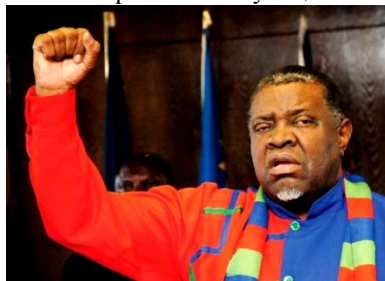
Кандидат СВАПО на пост президента Хаге Гейнгоб