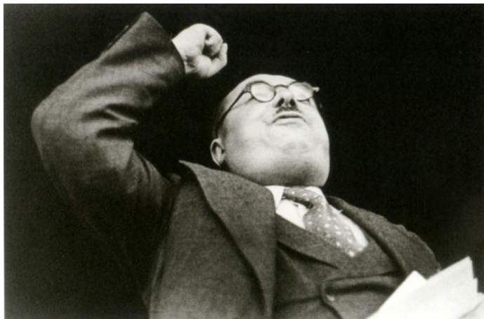
Жак Дюкло, лидер французской компартии, обращается к горожанам на День взятия Бастилии. Париж, 14 июля 1937 г.

гитлеровских оккупантов и их петэновских лакеев, человек, в течение полувека — с 1926 года — избравшийся в жесточайшей борьбе на альтернативных выборах во французский парламент, несмотря на тяжелейшие приступы уремии, от которых он мог умереть в любую минуту, даже на парламентской трибуне, не захотел молчать, когда князь-министр или, по выражению Дюкло, «новый ландскнехт антикоммунизма», публично и громкогласно позорит его идею, его партию, его товарищей, в первую очередь тех, кто отдал свою жизнь в борьбе с фашизмом.