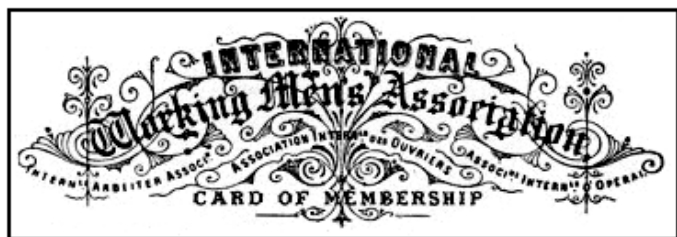
Членская карточка Первого интернационала

...3-й конгресс Интернационала в Брюсселе в сентябре 1868 г. стал важным пунктом в развитии МАТ, в ходе которого идеи антиавторитарного коллективизма мало-помалу распространялись в ассоциации. На нем было 102 делегата (56 бельгийцев, 18 французов, 11 англичан, 8 швейцарцев, 5 немцев, по 1 - из Испании и Италии). Прудонисты остались в явном меньшинстве, а марксистские и антиавторитарные коллективисты по ряду вопросов выступили вместе. Так, была принята резолюция о коллективизации (обобществлении) шахт и рудников, железных дорог, пахотных земель, дорог и каналов, телеграфных линий и иных средств сообщения, лесов.