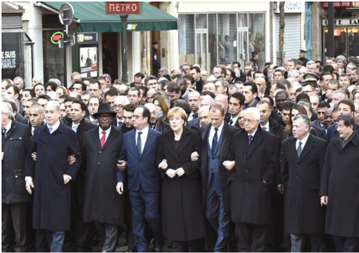
Фото мировых лидеров в Париже:

Биньямин Нетаньяху, Ибрахим Боубакар Кейта, Фрасуа Олланд, Ангела Меркель, Дональд Туск (президент ЕС), Махмуд Аббас, король Иордании Абдулла, Ахмет Давутоглу