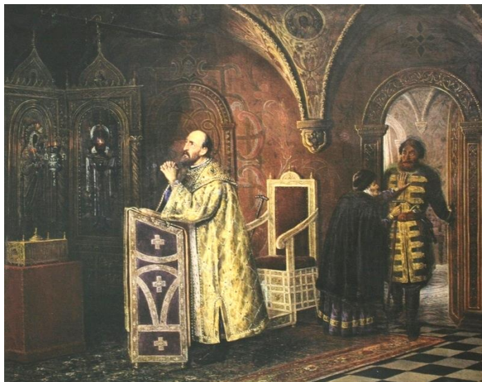
Пукирев Василий «Иван Грозный в молельне». 1884. Государственный музей истории религии, С.-Петербург

Почти четверть века капиталистическая Россия упорно искала подходящую для себя «национальную идею». Судя по всему, наконец-то нашла. Это «национальная идея» охранительного консерватизма, сохранения любой ценой пресловутой «стабильности», являющаяся на деле хорошо знакомой банальной проповедью мира и согласия угнетенных и ограбленных с теми, кто довел их до такого состояния. В первых рядах проповедников такого рода «национальной идеи» весьма заметна супруга бывшего президента РФ, нынешнего главного единоросса и по совместительству председателя правительства РФ Светлана Медведева.