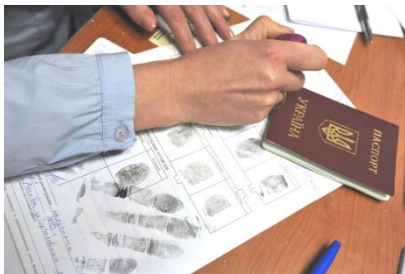
Оформление документов.

«Всё имеет свой конец, только у сосиски их два», — гласит немецкая пословица («Alles hat ein Ende, nur die Wurst hat zwei»). Справедливость этой народной мудрости, разумеется, с точки зрения соприкосновения с полицейскими и миграционными чиновниками — а это само по себе вряд ли приятно любому честному труженику независимо от гражданства и этнического происхождения, — скоро начнёт доходить и до многочисленных украинских трудовых мигрантов. До 1 августа 2015 года они могли без ограничения по срокам пребывания находиться в России и работать в нашей стране без каких-либо дополнительных разрешительных документов. С началом декабря эта практика должна уйти в прошлое, а прежние льготы отменяют.