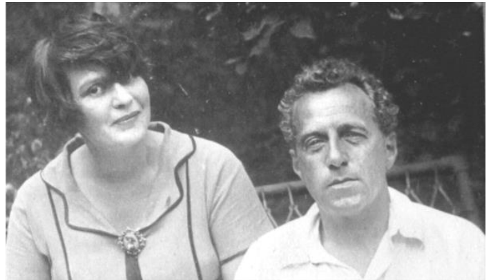
Зинаида Райх и Всеволод Мейерхольд

отказался от своих обличавших его как иностранного шпиона и троцкиста показаний, сделанных под пытками, которые он в том письме описал. Его жена актриса Зинаида Райх была зверски убита в своей квартире вскоре после ареста Мейерхольда.