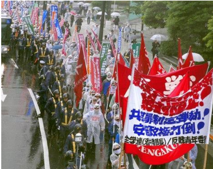
Против ядерной войны! Долой правительство Абэ! Демонстрация в Токио, 18 июня

Для того, чтобы устранить ядерную угрозу в регионе Корейского полуострова, народы США, Японии, Южной и Северной Кореи должны низвергнуть свои поджигательские правительства. Иного пути нет!