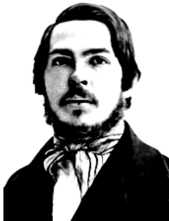
Фридрих Энгельс 1840-е годы

...Ещё в середине XVIII в. Англия была страной неволь ших городов, мало развитой промышленностью и главным образом земледельческого населения. Прошедший промышленный переворот преобразил лицо страны. С изобретением машин в хлопчатобумажной, шерстяной и в других отраслях промышленности, с появлением паровой машины, с возникновением фабрик Англия превратилась в промышленную страну, снабжавшую своими изделиями весь мир. Наряду со столицей