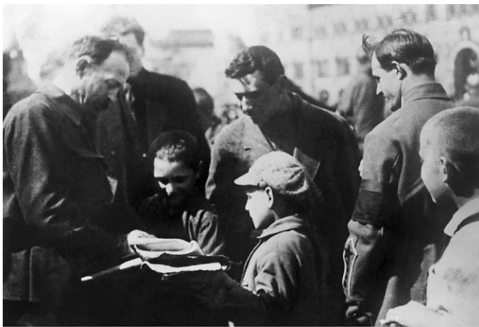
Ф.Э. Дзержинский даёт автограф детям на Красной площади. 1924 г.