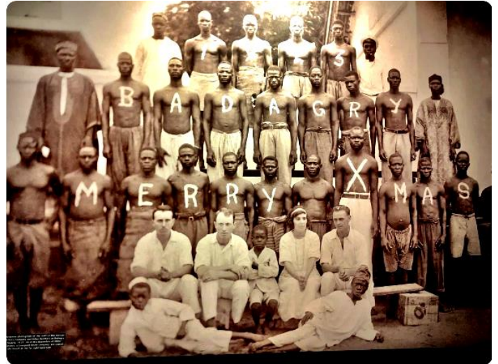
Точка зрения европейцев на то, как должны идти дела в колониях:

Несмотря на независимость африканских стран, Франция по-прежнему вмешивается в их внутренние дела и дело доходит до самоутверждения в экономике (франк КФА) и в военной сфере. Когда мы спрашиваем: «Почему?», они нам говорят, что знают лучше/они более цивилизованны и осведомлены, поэтому они должны иметь возможность направлять события в том русле, в котором они хотят. И при этом они говорят, что это для нашего же блага.