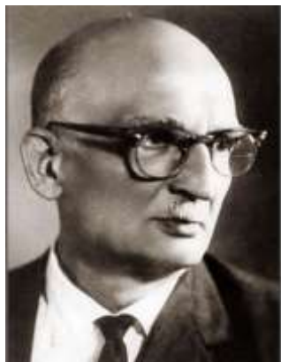
Р.И. Абель (1903-1971)

В музейном комплексе «Россия – моя история» (Басейная ул., 32) открылась выставка «Искренне ваш. Рудольф Абель», посвящённая 60-летию со дня завершения операции по возвращению на родину советского разведчика-незаконника Вильяма Генриховича Фишера (Рудольфа Ивановича Абеля) и 100-летию нелегальной разведки.