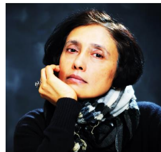
Конец 1990-х – начало 2000-х г.г.