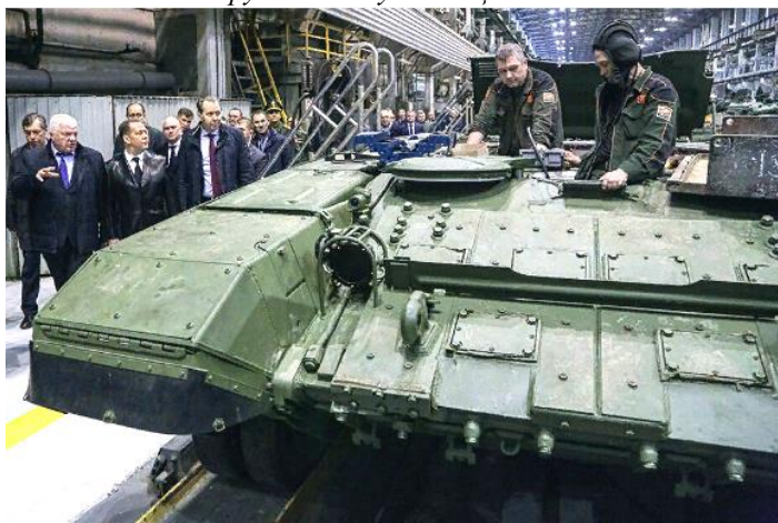
Нововведения в законе дают право госзаказчику в полной мере осуществлять контроль за исполнением гособоронзаказа.

«В СССР наличие сквозного контроля по всем технологическим и производственным процессам позволяло получить ясную картину и выявить узкие места, - отметил аналитик. – Сейчас усиление контроля за выполнением государственного заказа, с одной стороны, могло потребоваться для мониторинга ситуации на оборонных предприятиях, с другой - для недопущения проблем и преодоления трудностей, которые могут быть связаны, в частности, со снабжением чёрными и цветными металлами: хватает желающих хорошо заработать на их отгрузках для нужд защиты России».