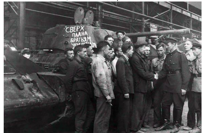
1942 год. Военные приёмщики принимают сверхплановый танк от рабочих одного из уральских заводов.

В то же время законопроект вводит возможность получать «любую информацию на всех стадиях поставки продукции, в том числе на стадии исполнения госконтрактов», говорится в пояснительной записке к документу. По сути, речь может идти о введении дополнительной, внешней линии контроля на производствах по аналогии с той, что была в Советском Союзе, считают эксперты.